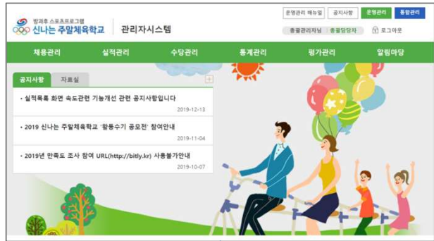
체육포털계정 통합계정으로 사용